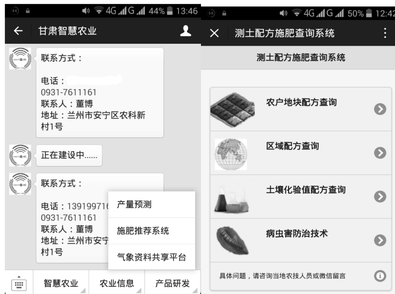
图2 微信菜单及施肥查询界面